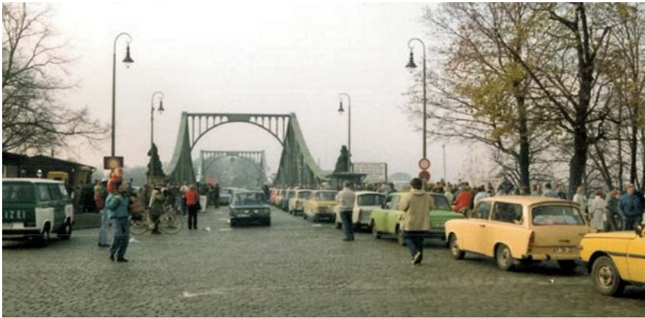
Die Glienicker Brücke nach dem Mauerfall im November 1989 nach deren Wiedereröffnung für den Zivilverkehr. Foto: Gavin Stewart, November 1989, CC-BY-2.0, Download von wikimedia commons

höhere und breitere Brücke zu ersetzen. Von 1906 bis 1907 wurde eine Stahlfachwerk-Version errichtet. Ihr Name Kaiser-Wilhelm-Brücke fand kein großes Interesse und geriet auf Dauer in Vergessenheit. Sie entwickelte sich mit ihren nahegelegenen Dampferanlegestellen zu einem beliebten Ausflugsziel. 1937 wurde die vielbefahrene Brücke auf ihre heutigen Maße verbreitert und erhöht. Gegen Kriegsende wurden bei einem Schusswechsel zwischen Soldaten der Wehrmacht und der Roten Armee zufällig zwei der zahlreichen Sprengladungen getroffen, die die Wehrmacht an den Brückenpfeilern befestigt hatte, wodurch die Brücke auseinanderbrach und der Mittelteil in die Havel stürzte, wo er zwei Jahre lang auf Grund lag, während der Straßenverkehr über eine provisorische Holzbrücke geführt wurde. Ende 1949 war die Stahlbrücke wieder aufgebaut. Die damalige brandenburgische Landesregierung benannte sie in „Brücke der Einheit“ um und zog in deren Mitte den erwähnten weißen Grenzstrich. Vom 3. Juli 1953 bis zum Mauerfall am 9. September 1989 war die Brücke für den Zivilverkehr gesperrt.