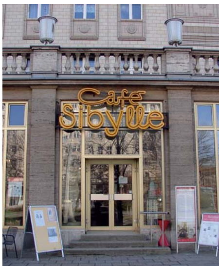
In den 1950er Jahren als „Milchtrinkhalle“ eröffnet, heute eine „Symbiose aus Kultur und Gastronomie“ (eigene Darstellung auf der Internetseite des Café Sibylle ) an der Karl-Marx-Allee 72

Nach dem Rundgang kann das erworbene Wissen bei Kaffee und Kuchen im Café Sibylle noch vertieft werden. Eine kleine Ausstellung dokumentiert hier die abwechslungsreiche Historie der Berliner Magistrale ab den 1940er Jahren.