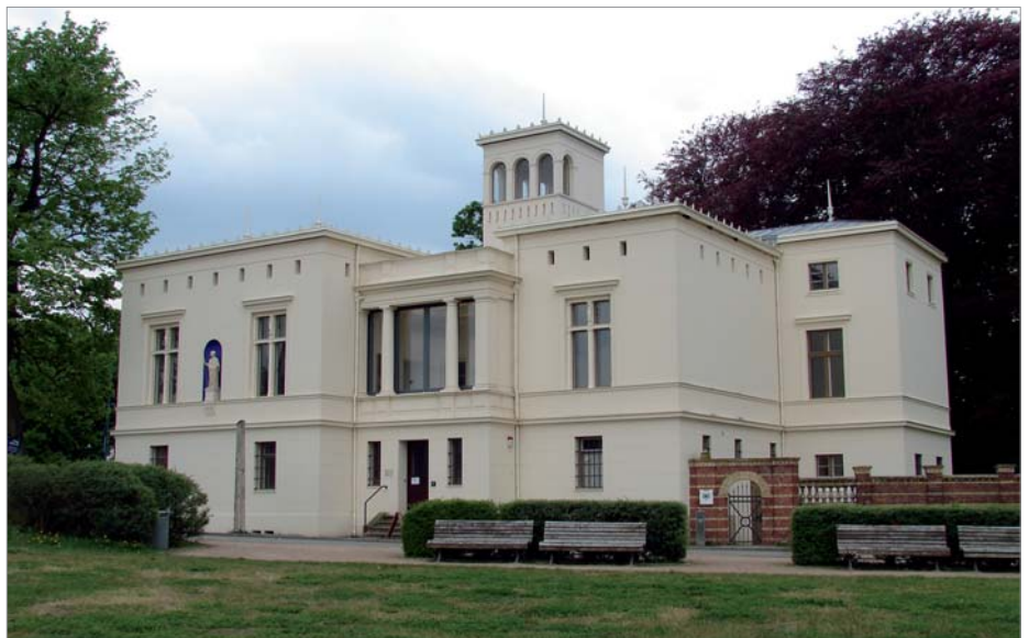
Im März 2007 kaufte ein Axel-Springer-Verlagsmanager zusammen mit einem Finanzmanager die zur Ruine verkommene Villa Schöningen mit dem Ziel einer denkmalgerechten Sanierung und öffentlichen Nutzung. Gut zweieinhalb Jahre später, am 8. November 2009, dem Vorabend des 20. Jahrestags des Mauerfalls, wurde dort von Bundeskanzlerin Angela Merkel, dem polnischen Außenminister Radosław Sikorski und dem ehemaligen US-Außenminister Henry Kissinger ein „ Deutsch-deutsches Museum “ eröffnet. Einer der zahlreichen prominenten Gäste war Michail Gorbatschow.

Foto: Doris Antony, 8. November 2006, CC-BY-SA-2.5, Download von wikimedia commons