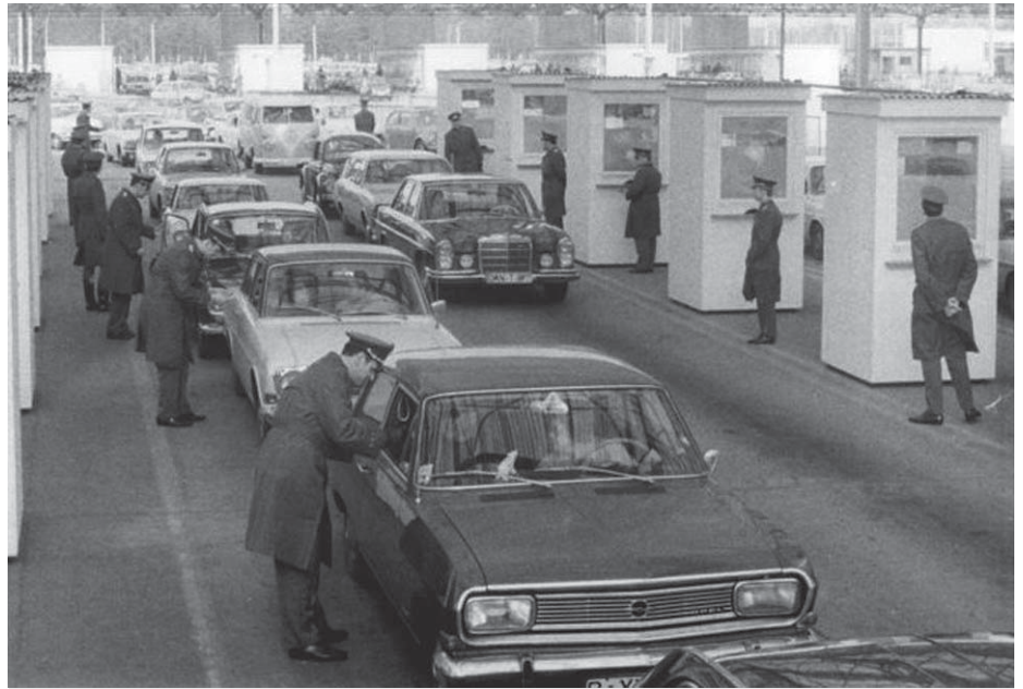
Mitarbeiter der Passkontrolleinheit am Grenzübergang Drewitz nahmen im März 1972 während einer kurzzeitigen Regelung die Ausweispapiere der Transitreisenden direkt an den Fahrzeugen entgegen, aus Sicht der DDR eine „Geste des guten Willens“. Vor Inkrafttreten des Transitabkommens hatten die Reisenden immer aussteigen müssen, um ihre Dokumente den Passkontrollleuten zu geben.

Eine weitere Verbesserung für die Reisenden war die Umstellung bei der Zahlung der Visagebühren. Bis dato hatten die Reisenden diese an der Grenze selbst bezahlen müssen. Auf Wunsch hatte ihnen die Bundesrepublik