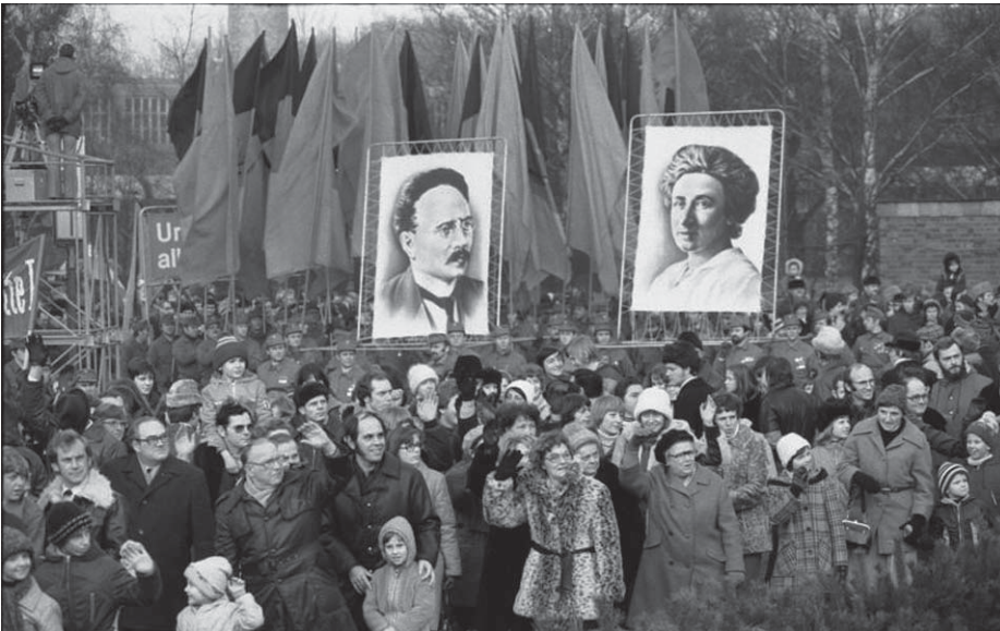
Ost-Berliner und DDR-Bürger ziehen mit Plakaten, auf denen die Konterfeis von Rosa Luxemburg und Karl Liebknecht abgebildet sind, am 15. Januar 1978 im Rahmen der alljährlichen Lenin-Liebknecht-Luxemburg-Demonstration zur Gedenkstätte der Sozialisten auf dem „ Sozialistenfriedhof “.

Foto: Joachim Spremberg, 15.01.1978, Bundesarchiv, Bild 183-T0115-009, CC-BY-SA 3.0, Download von wikimedia commons